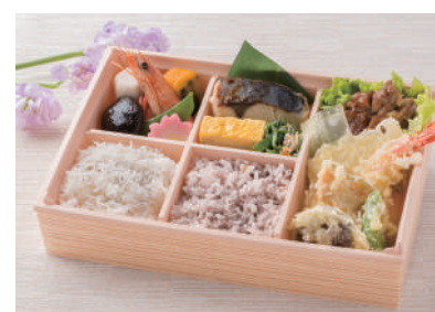
No.43 かつ重 1,100円(税別)