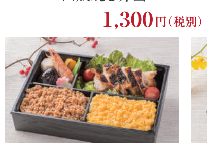
No.34 西京焼き弁当 1,300円(税別)