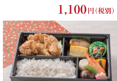
No.33 食べ比べ西京焼き弁当 1,400円(税別)