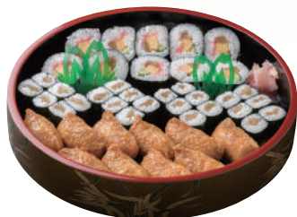
No.48 巻寿司いなり盛 3,000円(税別)