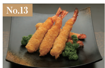
No.13 大エビフライ(6尾) 2,500円(税別)