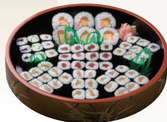
No.47 巻寿司六種盛 3,500円(税別)