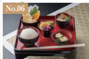
No.06 黒膳(仏式) 1,500円(税別)