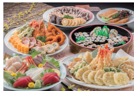
No.23 和風A 一人様 4,000円(税別)