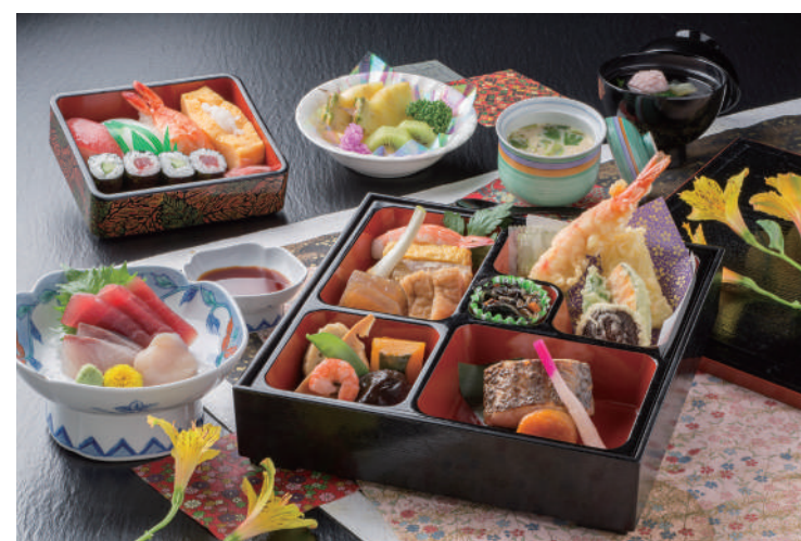
No.26 法事会席膳 しのぶ 4,000円(税別)