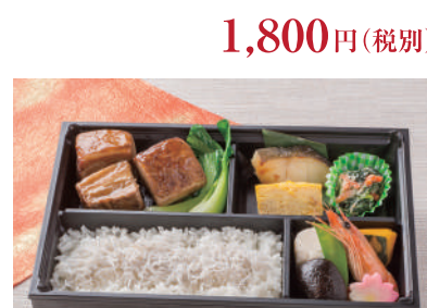
No.39 豚の角煮弁当 1,300円(税別)