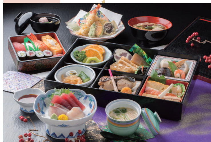
No.25 法事会席膳 おもかげ 5,000円(税別)