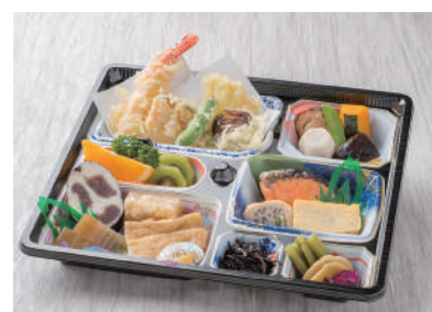
No.28 会席折詰 れんげ 3,500円(税別)