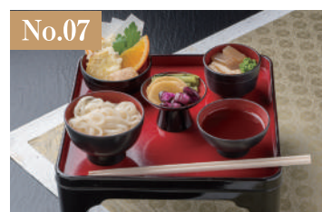
No.07 黒膳(神式) 1,500円(税別)