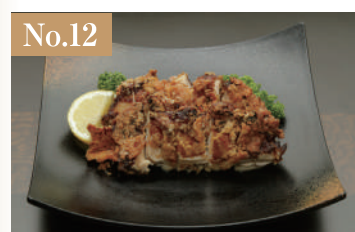
No.12 山賊焼 2,300円(税別)