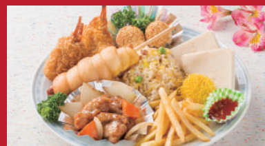
No.03 お子様膳 1,500円(税別)