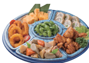
No.56 和風オードブルC 3,500円(税別)