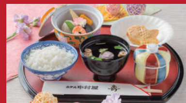
No.05 お食い初め膳 1,500円(税別)