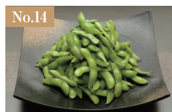
No.14 枝豆盛 1,000円(税別)