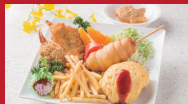
No.04 お子様プレート 1,000円(税別)