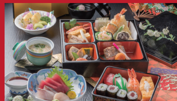
No.02 会席膳 宴 4,000円(税別)