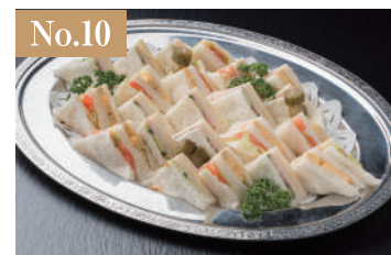
No.10 サンドイッチ 3,000円(税別)