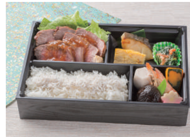
No.38 塩尻名物山賊焼き弁当 1,300円(税別)