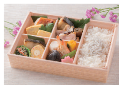
No.37 塩尻ポークの生姜焼き弁当 1,200円(税別)