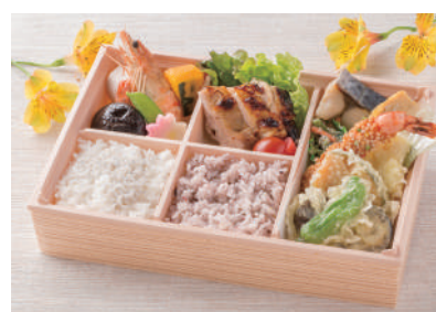
No.30 蟹ちらし二段重 1,800円(税別)