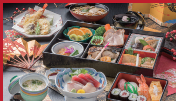
No.01 会席膳 華 5,000円(税別)