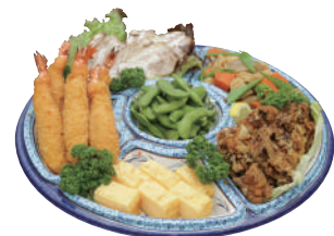
No.54 和風オードブルA 4,500円(税別)