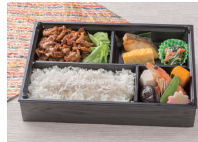
No.44 鶏そぼろ重 950円(税別)