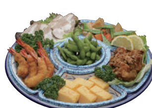
No.55 和風オードブルB 4,000円(税別)