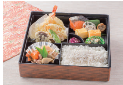
No.32 中村屋特選弁当 2,000円(税別)