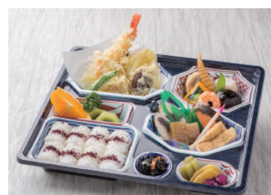
No.29 会席折詰 すみれ 3,500円(税別)