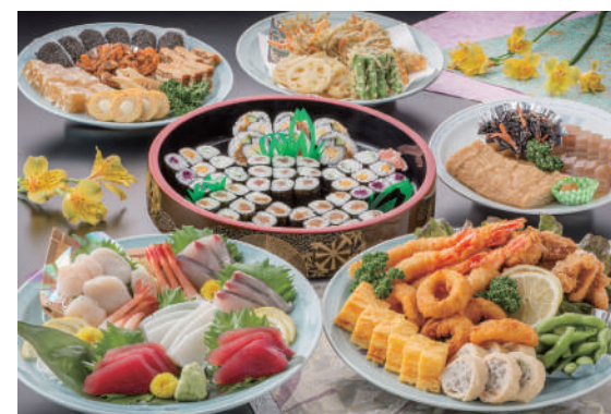
No.24 和風B 一人様 3,000円(税別)