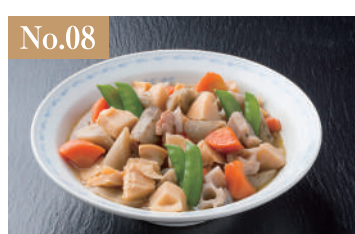
No.08 筑前煮 2,000円(税別)