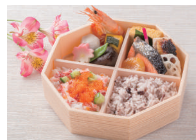
No.42 穴子重 1,800円(税別)