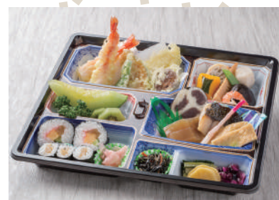
No.27 会席折詰 あやめ 4,000円(税別)