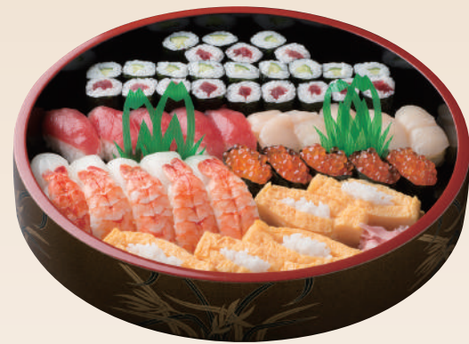
No.45 中村屋上盛 7,500円(税別)