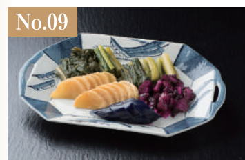
No.09 漬物 1,200円(税別)