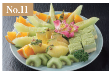
No.11 フルーツ盛 3,000円(税別)