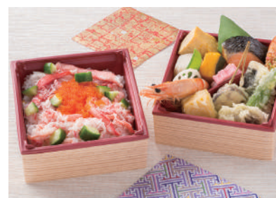
No.36 国産牛ローストビーフおろしソース弁当 1,800円(税別)