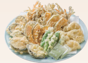
No.51 天ぷら盛 かき揚げ、かぼちゃ、れんこん、なす、ししとう 2,000円(税別)