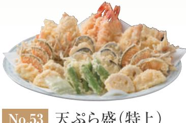
No.53 天ぷら盛(特上) 海老、穴子、かき揚げ、かぼちゃ、れんこん、なす、ししとう 4,000円(税別)