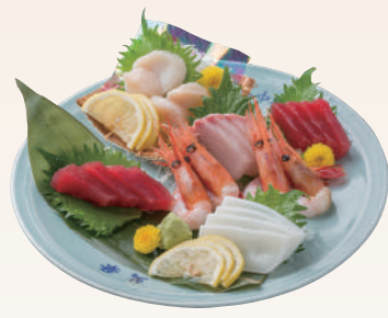
No.49 刺身盛 A 5,000円(税別)