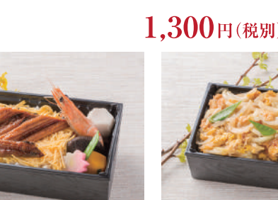
No.40 塩尻ポークの信州みそだれ焼き弁当 1,400円(税別)