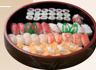
No.46 中村屋盛 6,000円(税別)