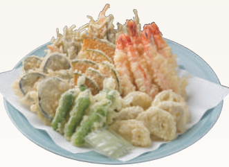
No.52 天ぷら盛(上) 海老、かき揚げ、かぼちゃ、れんこん、なす、ししとう 3,000円(税別)